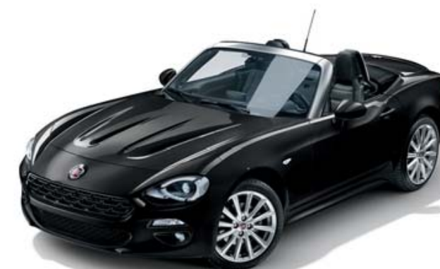
5DN PRETO VESUVIO - METALIZADO