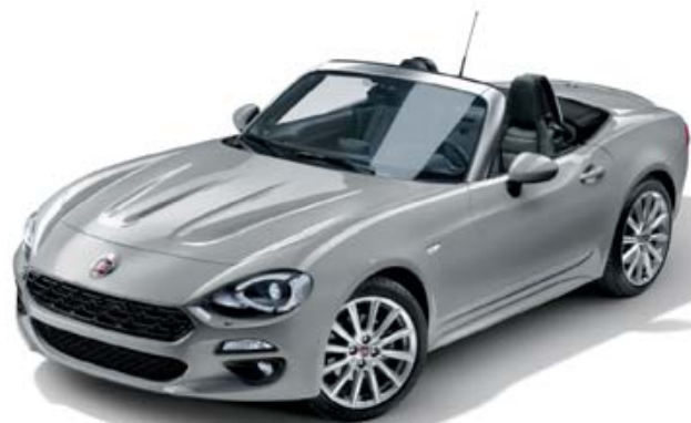
5CD CINZENTO ARGENTO - METALIZADO