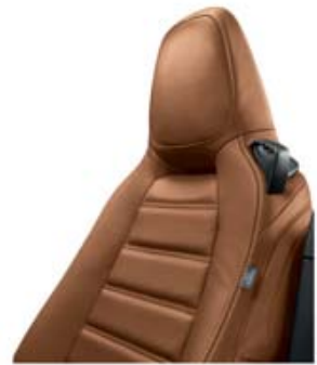
470 - PELE CAMEL (LUSSO)