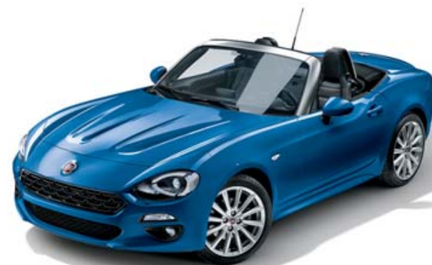
5CC AZUL ITALIA - METALIZADO