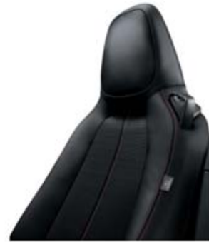
008 TECIDO (124 SPIDER)