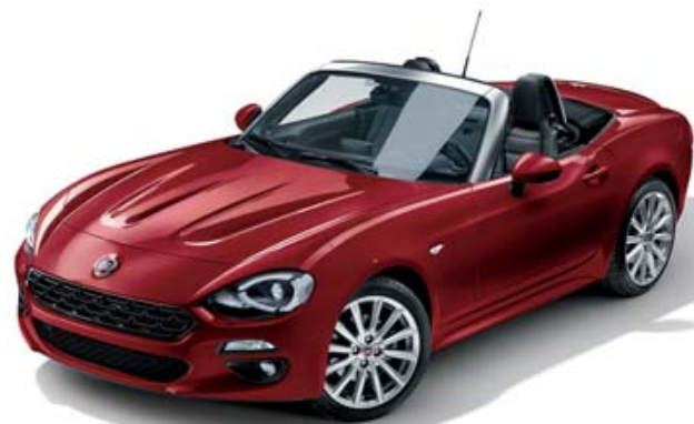
5CA VERMELHO PASSIONE - PASTEL

CADA PORMENOR DO NOVO FIAT 124 SPIDER FOI CONCEBIDO PARA BRILHAR. ESTE ROADSTER EXTRAORDINÁRIO ESTÁ DISPONÍVEL EM OITO CORES DIFERENTES E COM JANTES EM LIGA LEVE DE 16" OU 17", DE DESIGN INCONFUNDÍVEL. MAS SE O SEU ASPETO É APELATIVO, OS DETALHES A BORDO DO 124 SPIDER SÃO AINDA MAIS ATRAENTES. NA VERSÃO LUSO, OS BANCOS EM PELE PODEM SER NA COR PRETA OU CAMEL. SÓ TERÁ DE ESCOLHER E MOSTRAR A SUA PERSONALIDADE.