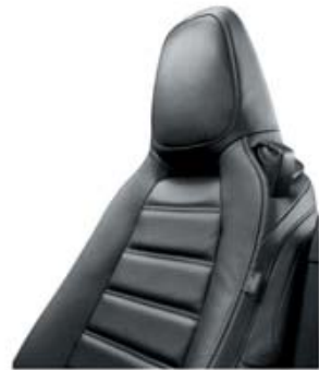
404 - PELE PRETA (LUSSO)