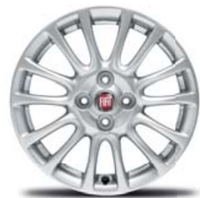
JANTES EM LIGA LEVE DE 16" (124 SPIDER)