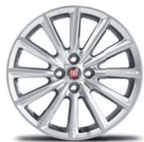
JANTES EM LIGA LEVE DE 17" (LUSSO)