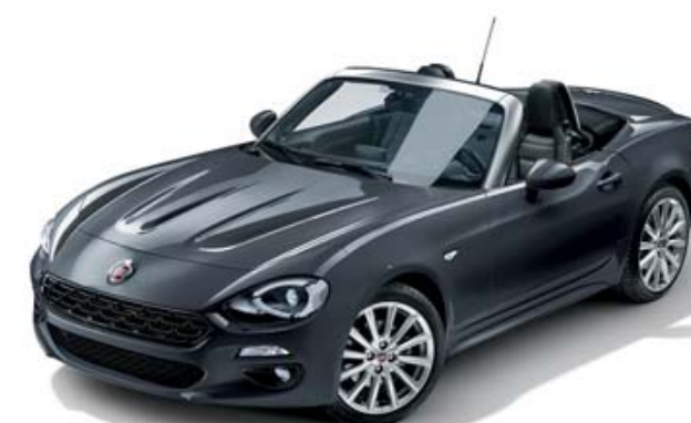
5CE CINZENTO MODA - METALIZADO