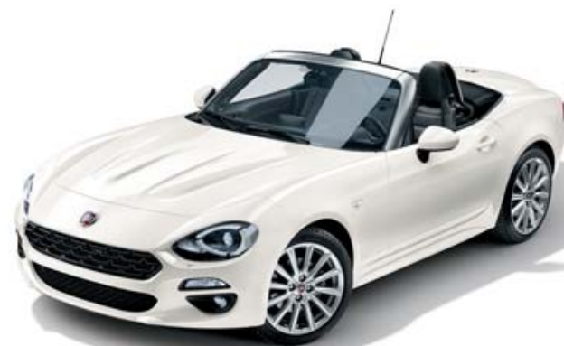
802 BRANCO GHIACCIO - TRICAMADA