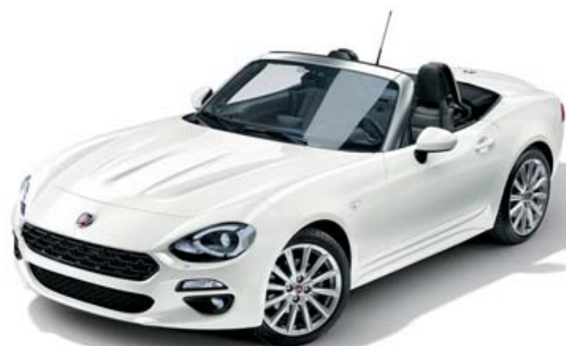
5CB BRANCO GELATO - PASTEL